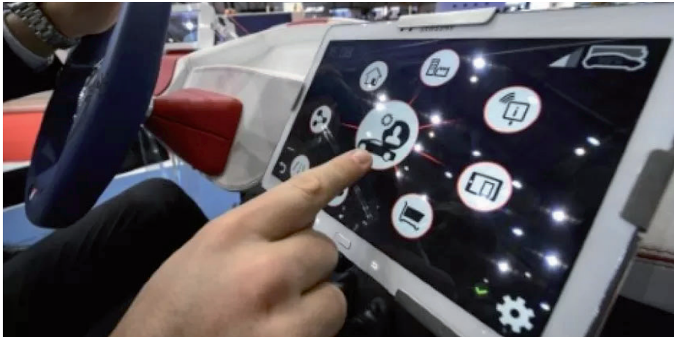
La société Optimum Automotive veut accélérer son développement sur le marché des véhicules autonomes et connectés

Cette société installée à Aix a procédé à une levée de 14 millions d'euros avec l'ambition affirmée d'accentuer son développement sur le marché français et dans plusieurs pays étrangers